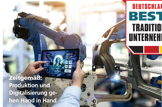
Zeitgemäß: Produktion und Digitalisierung gehen Hand in Hand